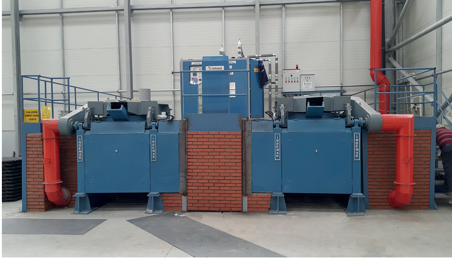
Kurulum, Devreye Alma, Taşınma gibi Diğer Tüm Mühendislik Hizmetleri

İndemak, indüksiyon ocakları konusunda servis bakımı, montaj, kurulum, parça imalatı ve soğutma sistemleri ile ilgili danışmanlık hizmeti de vermektedir.