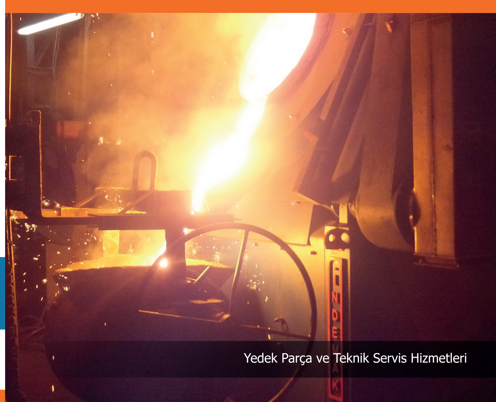
Yedek Parça ve Teknik Servis Hizmetleri

İndemak, indüksiyon ocakları konusunda servis bakımı, montaj, kurulum, parça imalatı ve soğutma sistemleri ile ilgili danışmanlık hizmeti de vermektedir.